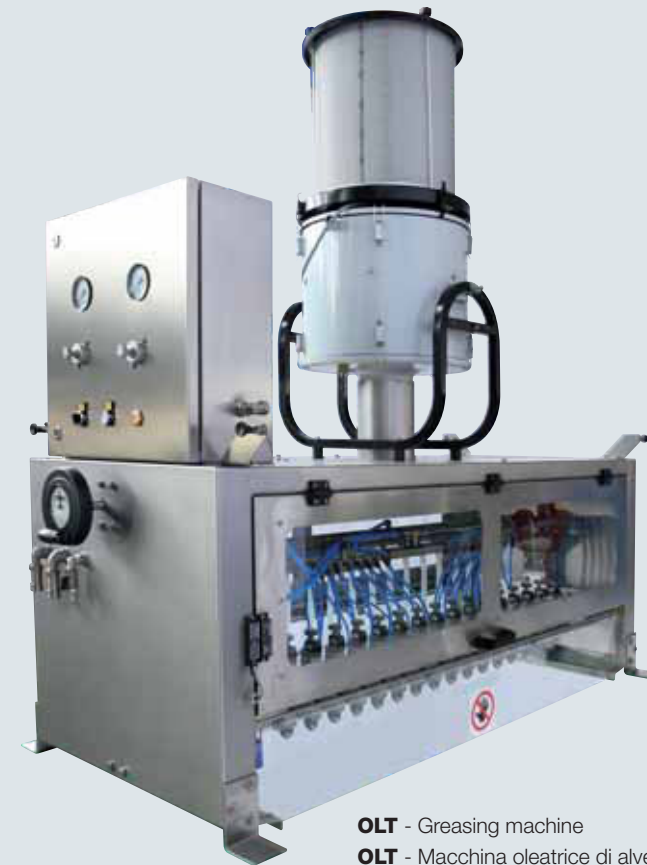
OLT - Greasing machine OLT - Macchina oleatrice di alveoli