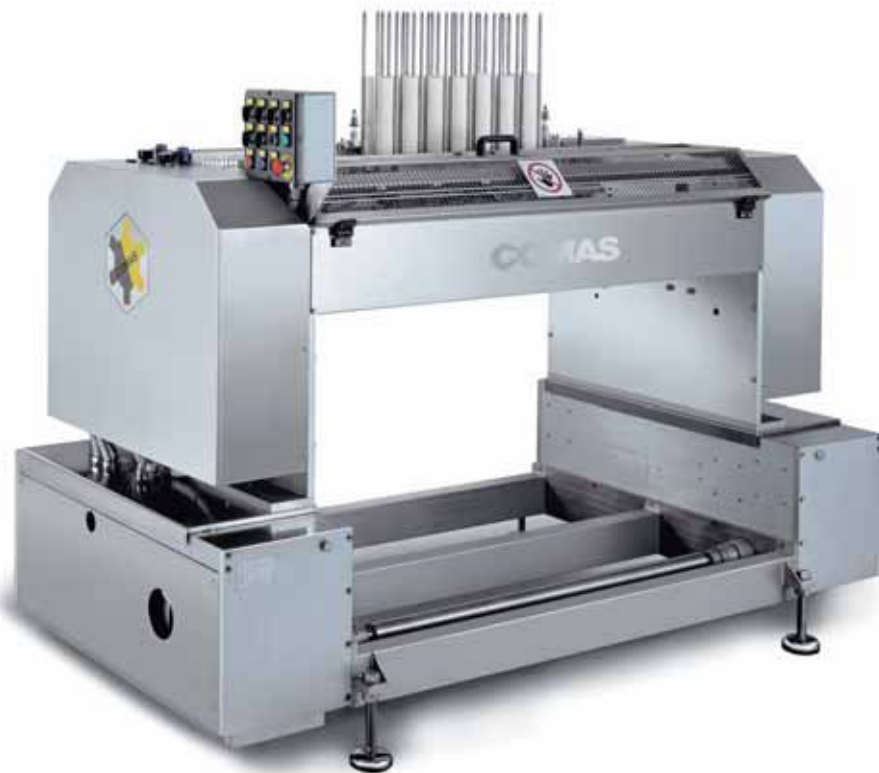
NC - Paper cup dispenser NC - Disimpiatore per pirottini di carta

COMAS SpA, as always willing to satisfy the requirements of its customers, is pleased to introduce a new series of machines for assemblage on depositing lines for smooth batters.