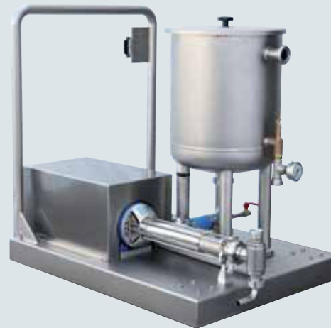
Grease feeding pump. Pompa per alimentazione prodotto staccante.

COMAS SpA, da sempre orientata a soddisfare le esigenze dei propri clienti, è lieta di presentare una nuova serie di macchine per la composizione di linee di dosaggio colati. In particolare le nuove testate dei dosatori e iniettatrici sono montate su telai con apposito carrello, facilmente estraibili dalle linee di produzione. Altre migliorie riguardano le motorizzazioni dei vari macchinari. I movimenti orizzontali, verticali e dei pistoni dosatori sono eseguiti per mezzo di servomotori brushless. Tutte le funzioni delle macchine sono gestite da PLC che consentono di memorizzare i dati di lavoro relativi a ogni prodotto in uno specifico programma.