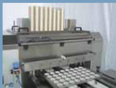
deposito pirottini paper cups dispensing